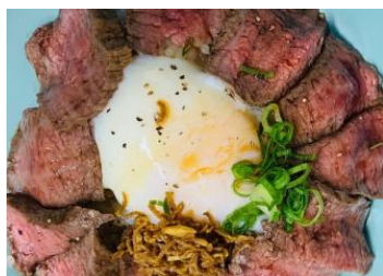
国産牛ローストビーフ丼 スープ付 ¥1,450