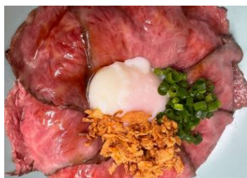
黒毛和牛ローストビーフ丼 スープ付 ¥1,650