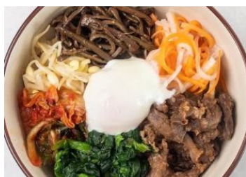
ビビンバ スープ付 ¥800