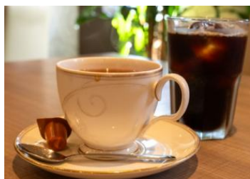
食後のコーヒー、紅茶 ¥150