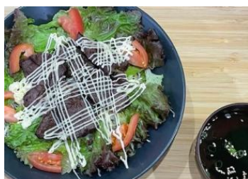
シシリアンライス スープ付 ¥1,000