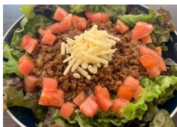
タコライス スープ付 ¥900