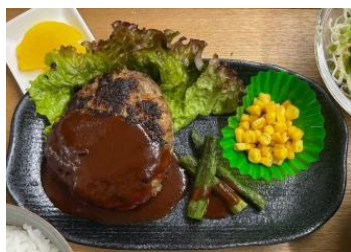
平日 日替わりランチ スタッフにお尋ねください