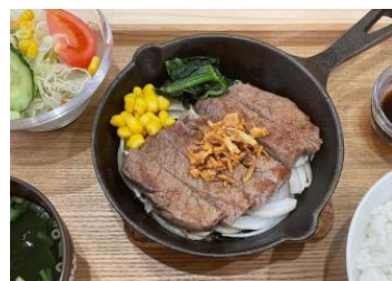
黒毛和牛ステーキランチ ライス、サラダ、スープ付 ¥1,700