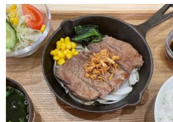
黒毛和牛ステーキランチ ライス、サラダ、スープ付