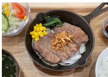
国産牛ステーキランチ ライス、サラダ、スープ付