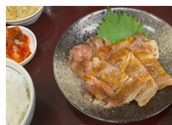
カルビ 焼肉定食 ライス、サラダ、スープ付